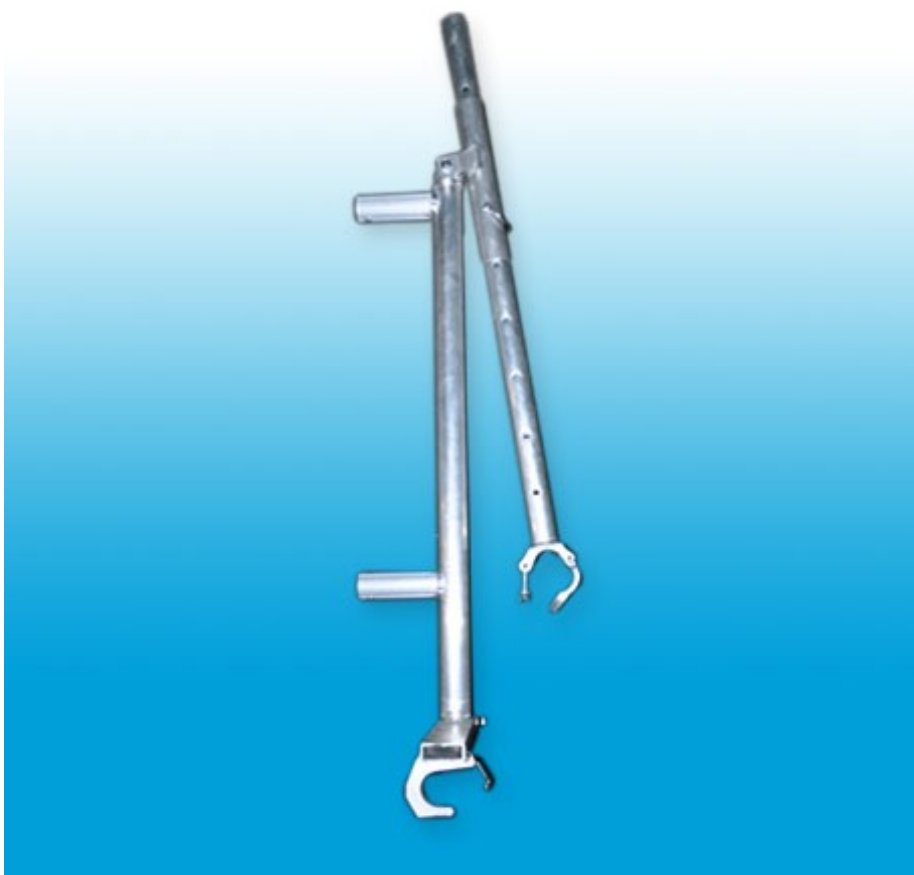
Afbeelding 5: Draagconsole