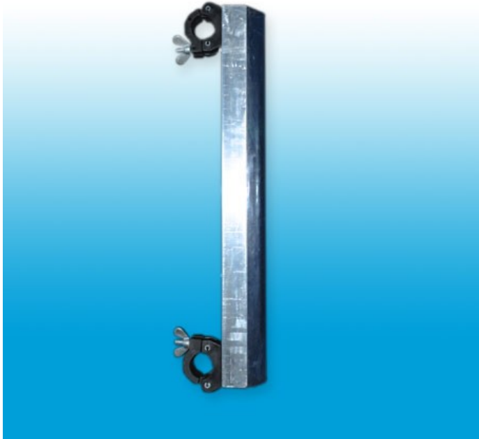
Afbeelding 4: Dakstabilisator met beschermrubber