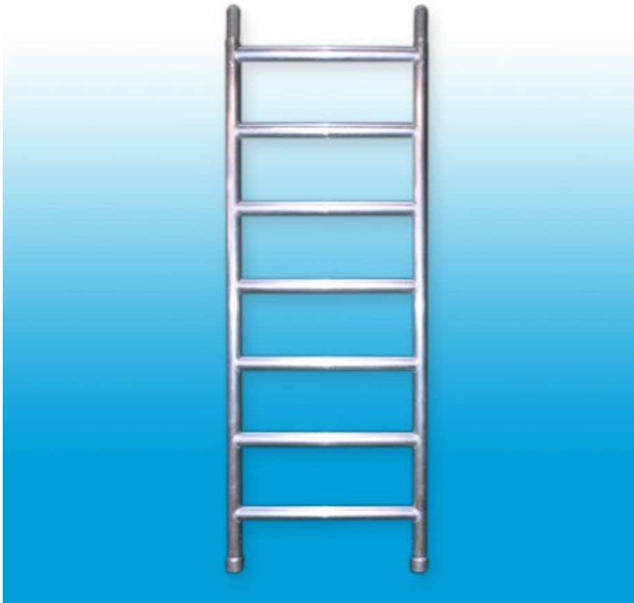
Afbeelding 6: Daksteiger frame