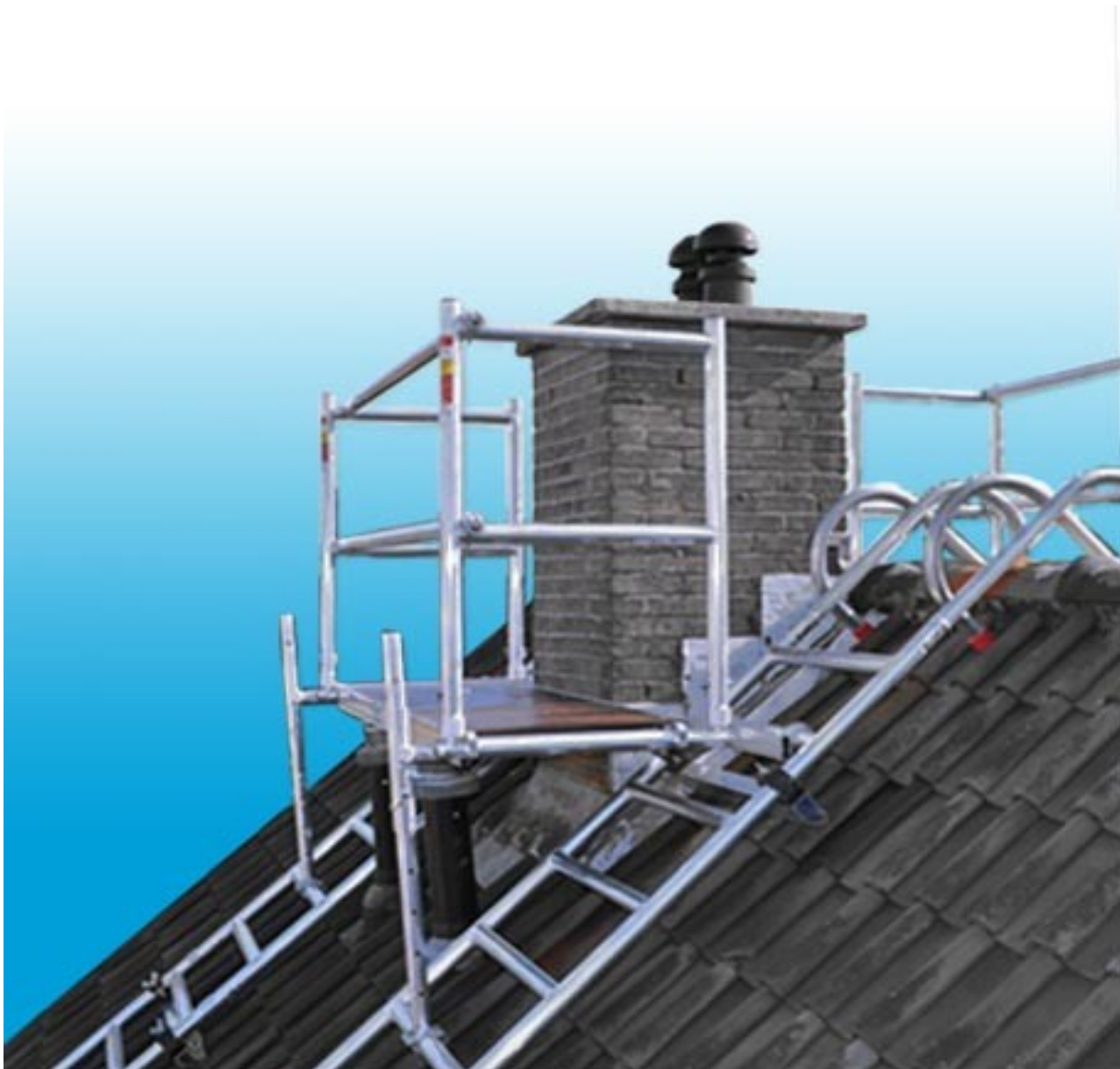
Afbeelding 1: Afbeelding opgebouwde schoorsteen daksteiger.