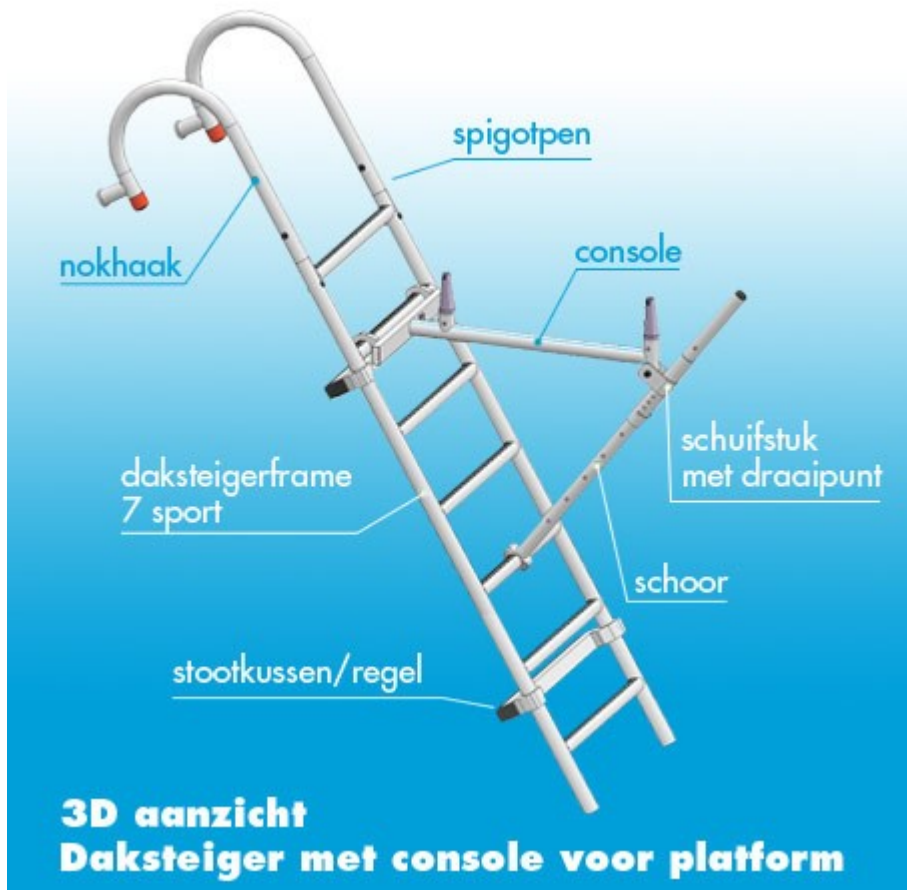
Afbeelding 2: Onderdelen DAK- Schoorsteensteiger compleet 190